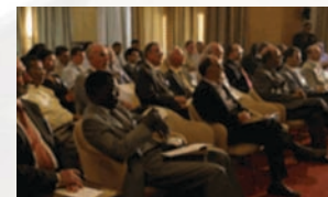
Séminaire 2006 EPAM – Sousse (Tunisie)