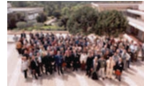
Colloque ePrep 2002 Sophia Antipolis