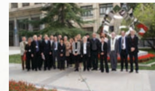
Séminaire 2008 Ecole centrale de Pékin (Chine)