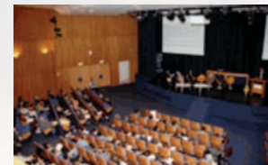
Colloque ePrep 2006 ESSEC – cergy-Pontoise