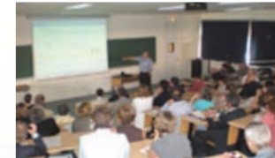
Colloque ePrep 2008 Supélec – Gif-sur-Yvette