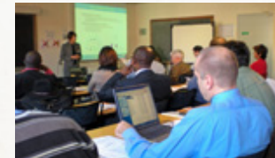
Séminaire 2009 Institut Henri Poincaré (Paris)