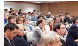
Colloque ePrep 2004 TMSP - Evry