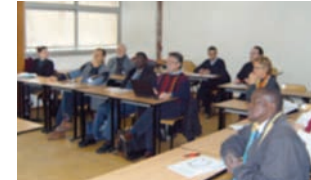
Séminaire 2007 INSA de Lyon