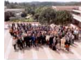
Colloque ePrep 2002 Sophia Antipolis