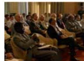
Séminaire ePrep 2006 EPAM - Sousse (Tunisie)