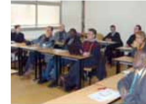
Séminaire ePrep 2007 INSA - Lyon