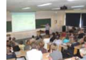
Colloque ePrep 2008 Supélec - Gif-sur-Yvette