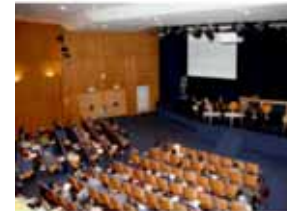
Colloque ePrep 2006 ESSEC - Cergy-Pontoise