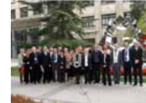
Séminaire ePrep 2008 Ecole centrale de Pékin - Pékin (Chine)