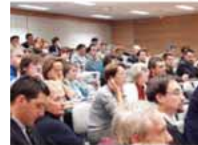
Colloque ePrep 2004 INT - Evry