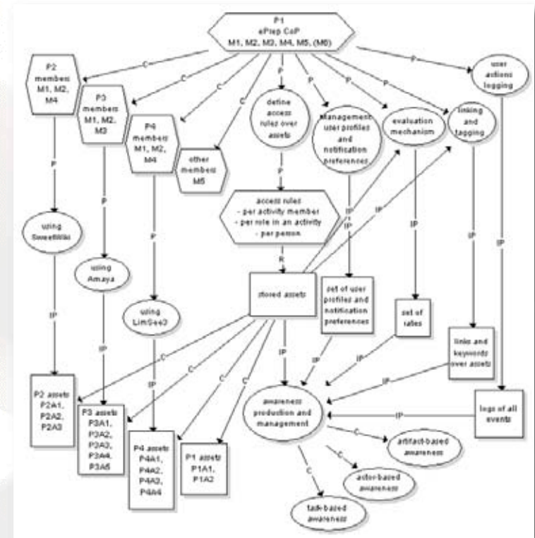
Scénario de la CoP ePrep utilisant un schéma Mot (N. Van de Wiele - PALETTE - WP5 - Task 4 - 2007)